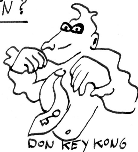
DON KEY KONG