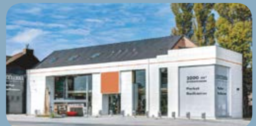
Afdeling PARKET - BADKAMER