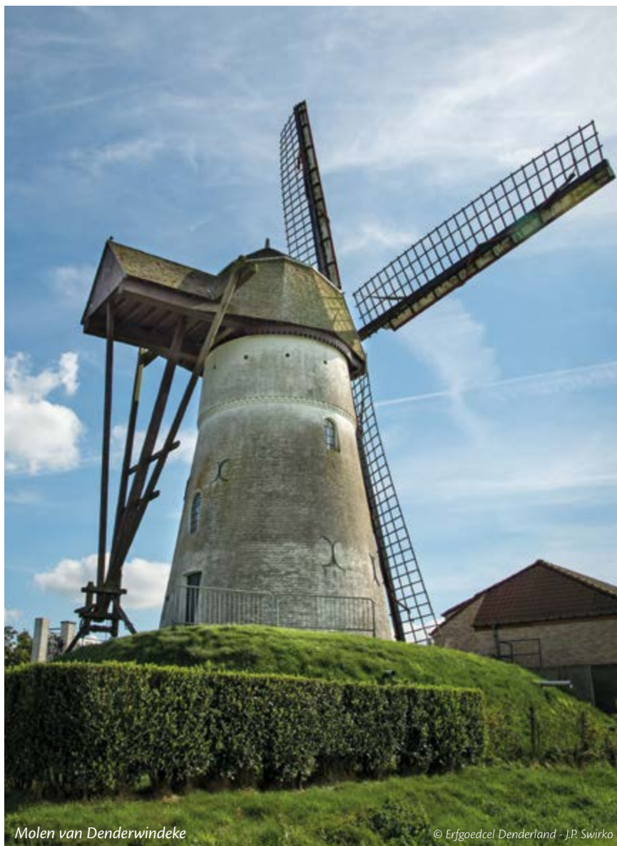
Molen van Denderwindeke

Dienst toerisme toerisme@ninove.be 054 50 52 90