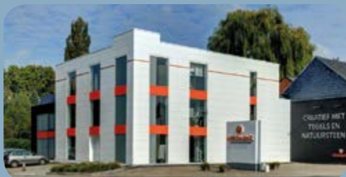
Afdeling TEGELS - NATUURSTEEN

Brusselsesteenweg 366-368, 9402 Meerbeke 054 33 10 89 | www.veronove.be