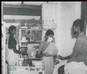
verzorging van een leprapatiënt in Polambakkam