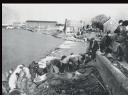
overstroming 1953. India levert jute voor de aanmaak van zandzakjes aan België